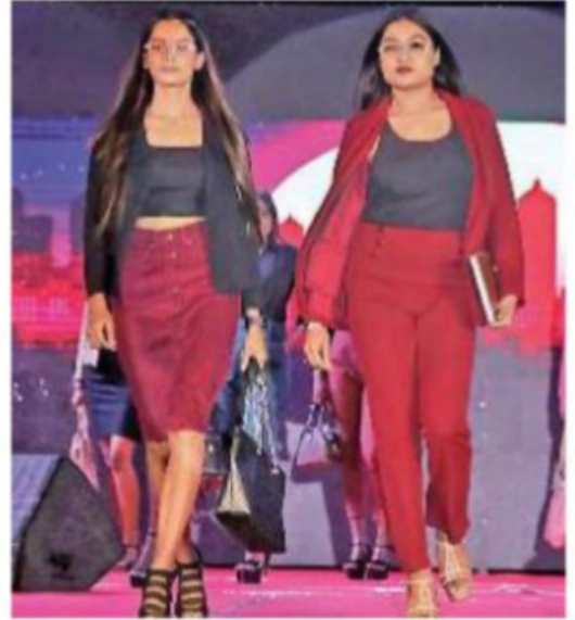
एक्सआईएसएस पनाश में फैशन शो में प्रतिभागी छात्राएं