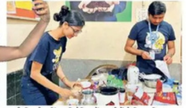
इटसी-बिटसी कुकिंग प्रतियोगिता में 10 टीमों ने हिस्सा लिया।