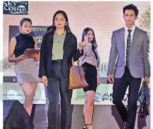
अंशम-अंशम वेशभूषा में दिखे प्रतिभागी ●जगहरा

पनाश का आज पहला दिन था। आज हम सभी ने बहुत एंजवाय किया। विभिन्न प्रतियोगिताओं में स्टूडेंट्स ने भाग लिया। कल डिजे नाइट में और मस्ती होगी।